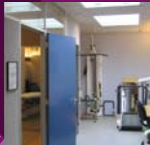
Interieur locatie Glacisweg