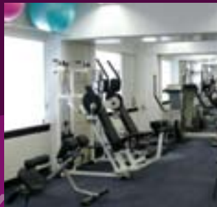
Interieur locatie Parkweg