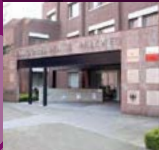
Entree locatie Parkweg